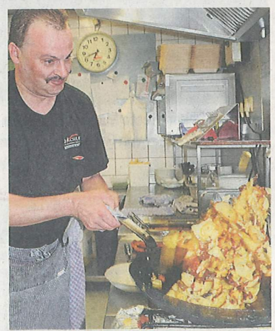
In der Küche werden die Bratkartoffeln im Akkord zubereitet.

Käse Allerdings lässt das Angebot für Vegetarier etwas zu wünschen übrig. Nur Gehaltvolles wie gebackener Camembert, Kässpätzle oder Käswürfel findet sich auf der Karte. Selbst die leckeren Salate haben alle Fleischbeilage. Fleisch, ins-